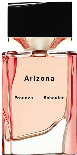
di Samira Solimeno

Come di consueto, con l'arrivo della primavera, le case di moda sfornano nuove fragranze. Vediamone alcune.